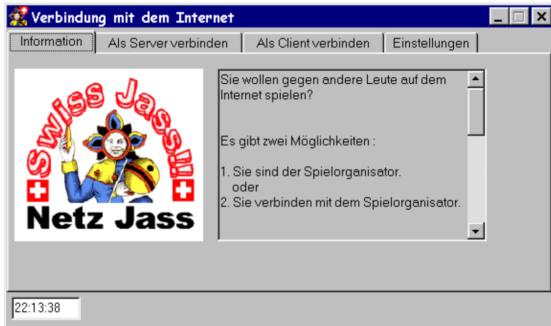
Bild 1 Verbinden via Internet